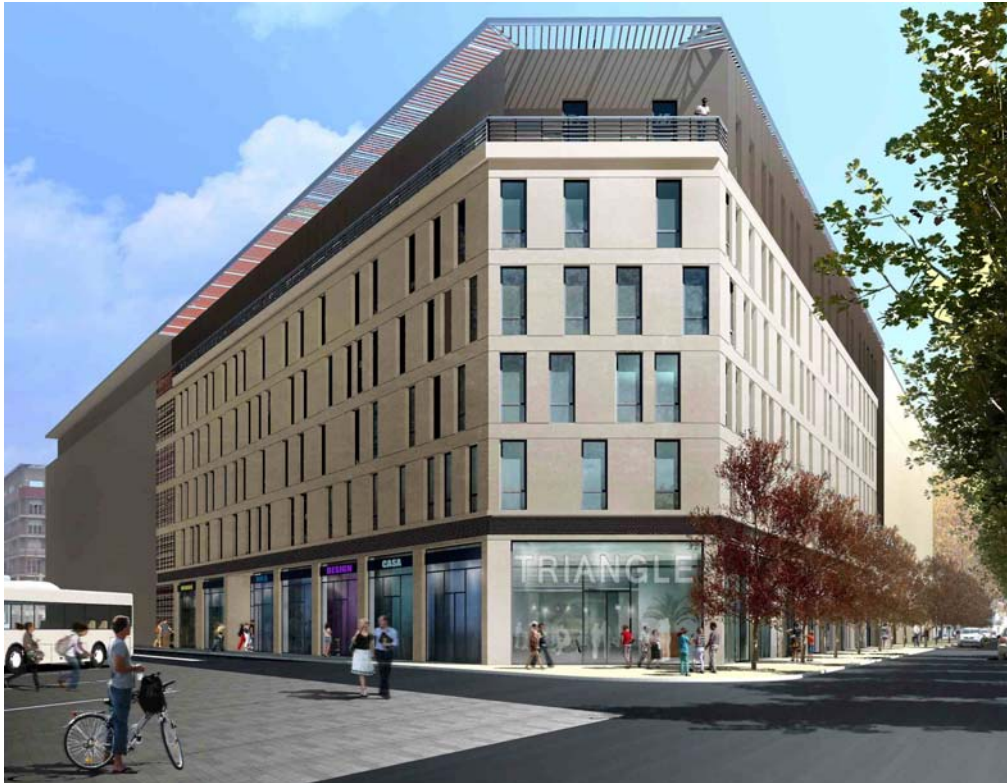
Perspective du projet depuis le boulevard Natoire.